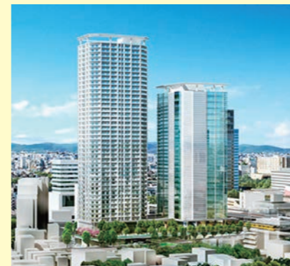
JR中野駅南口 再開発計画