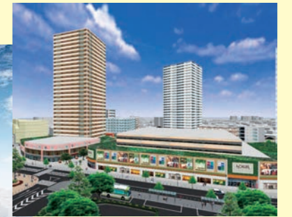
JR小岩駅前再開発計画